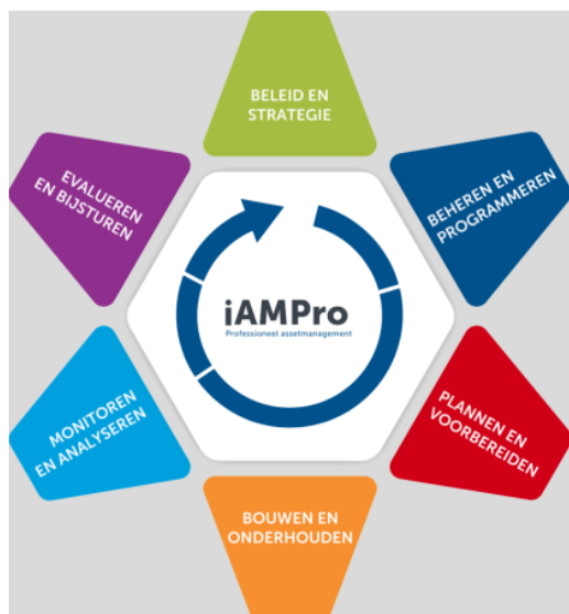
De beheercirkel – roos van iAMPro

Het proces voor doelmatig en duurzaam beheer wordt vormgegeven met de beheercirkel, gebaseerd op de roos van iAMPro. Hiermee wordt het beheer op een gestructureerde en overzichtelijke wijze georganiseerd.