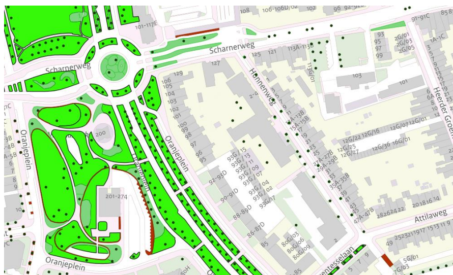
Asset-registratie in Obsurv